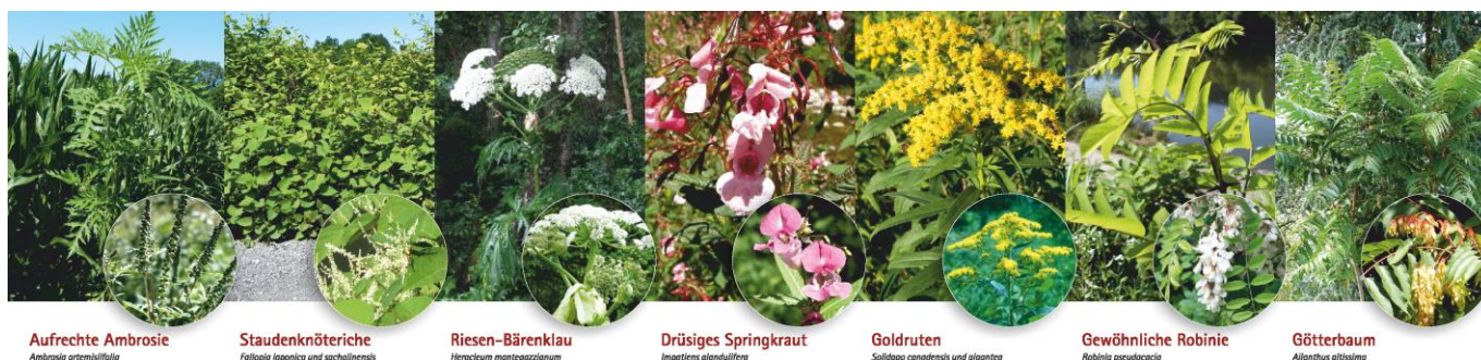
Aufrechte Ambrosie Ambrosia artemisiifolia

Einen Übersichtsfolder haben wir bereits in der Juni-Info beigelegt.